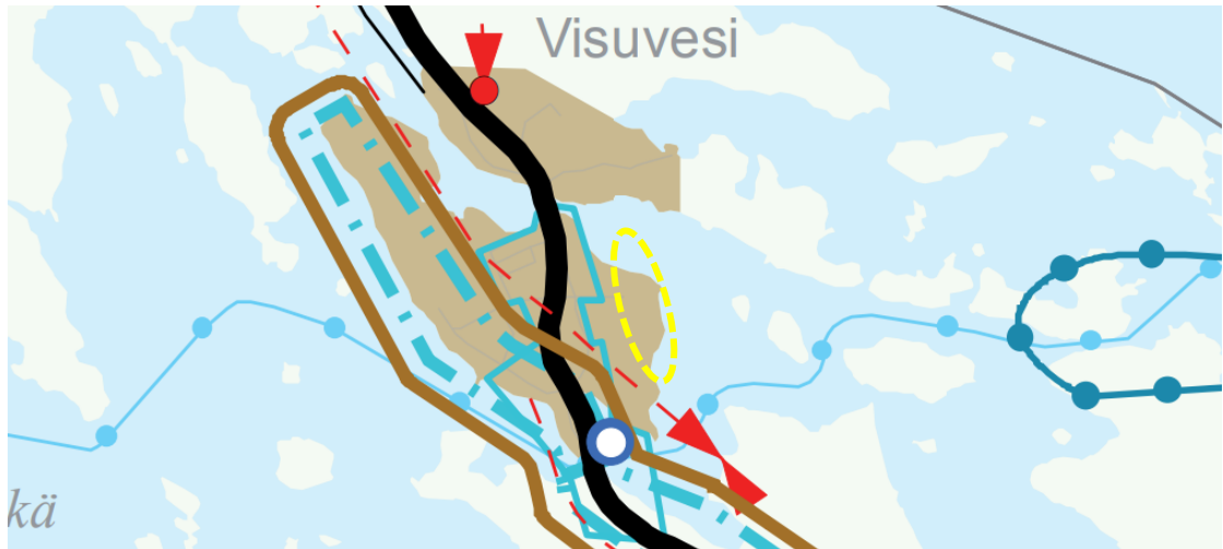
Kuva 2. Ote Pirkanmaan maakuntakaavasta. Suunnittelualan likimääräinen sijainti on osoitettu keltaisella katkoviivalla. (Pirkanmaan liitto 2017)

Maakuntakaavassa suunnittelualue on taajamatoimintojen aluetta (■). Merkinnällä osoitetaan erilaisten taajamatoimintojen, kuten asumisen, palveluiden ja työpaikkojen rakentamisalueet. Uusi maankäyttö täytyy sovitaa ympäristöön.