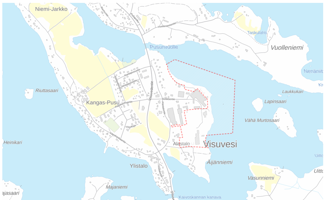
Kuva 1. Asemakaavan rajausta likimääräisesti punaisella katkoviivalla. (MML 2019)

Suunnittelualue sijaitsee Visuveden saaren itäosassa. Suunnittelualueen länsipuolella on Visuveden teollisuusaluetta. Suunnittelualueella on ennen toiminut saha ja se on ollut kokonaisuudessaan teollisuusaluetta. Visuveden saarella sijaitsee teollisuuden lisäksi myös Visuveden koulu, erilaisia palveluita ja asutusta. Visuveden taajamassa asuu noin 300 henkilöä. Saaren läpi kulkee kantatie 66 (Orivesi-Lapua).