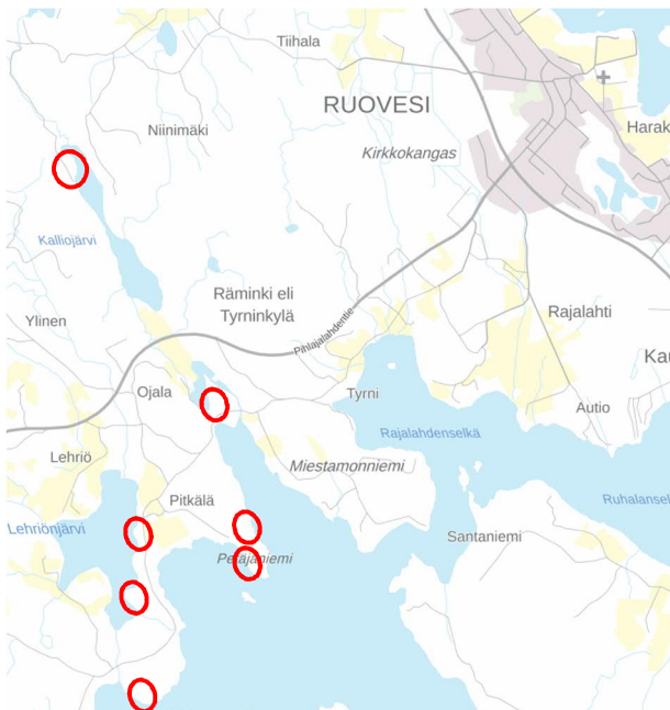
Kuva 1. Rantaosayleiskaavan muutettavien alueiden likimääräiset sijainnit osoitettu punaisilla soikioilla.

Suunnittelualue sijaitsee Ruoveden kunnassa, Rämingin kylän läheisyydessä, noin 4 km keskustajamasta lounaaseen. Kaava-alue sijaitsee neljän eri vesistön rannassa: Kalliojärvi, Lehriönjärvi, Paarlampi ja Näsijärvi. Suunnittelualueet kuuluvat kiinteistöille 702-415-1-106 ja 702-415-1-107. Ranta-alueet ovat tavanomaisessa maa- ja metsätalouksikäytössä.