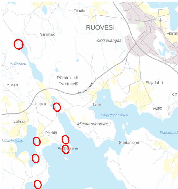
Kuva 1. Rantaosayleiskaavan muutettavien alueiden likimääräiset sijainnit osoitettu punaisilla soikioilla. (MML 2020)

Suunnittelualue sijaitsee Ruoveden kunnassa, Rämingin kylän läheisyydessä, noin 4 km keskustaajamasta lounaaseen. Kaava-alue sijaitsee neljän eri vesistön rannassa: Kalliojärvi, Lehriönjärvi, Paarlammi ja Näsijärvi. Suunnittelualueet kuuluvat kiinteistöille 702-415-1-106 ja 702-415-1-107. Ranta-alueet ovat tavanomaisessa maa- ja metsätalouksikäytössä.