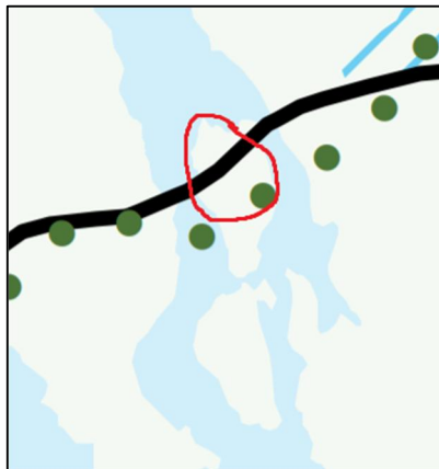
Kuva 2. Ote Pirkanmaan maakuntakaavasta 2040. Kuvassa suunnittelualueen likimääräinen raja.

Pirkanmaan maakuntakaavassa 2040 suunnittelualueen halki kulkee tärkeä seutu- tai yhdystie (Tuuhoskyläntie (tienumero 3481)) sekä suunnittelualueen eteläosan läpi kulkee maakunnallisesti ja seudullisesti merkittävä ohjeellinen ulkoilureitti.