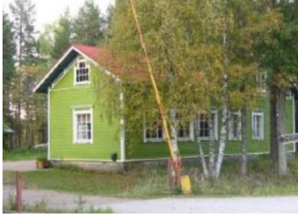
Kuva 1. Suunnittelualueelle jäävä Tuuhosen vanha kansakoulu

Alueella sijaitsee Tuuhosen vanha kansakoulu, joka on rantaosayleiskaavassa luokiteltu maakunnallisesti arvokkaaksi kulttuuriympäristöksi. Tuuhosen kylän kansakoulu on perustettu vuonna 1899 ja uusrenessanssityylien, puinen koulurakennus on samalta vuodelta. Koulu on lakkautettu vuonna 1966 ja on toiminut tonttialueineen Ruoveden kunnan omistamana leirikeskuksena. Kiinteistö jää tontille, vaikka leiritoimintaa ei enää ole.